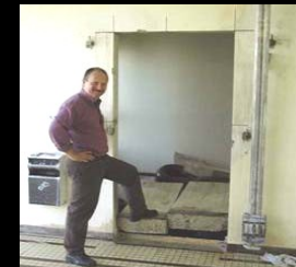
Ouverture de porte dans un mur en béton armé