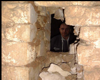
Réalisation d'ouverture dans un mur ancien