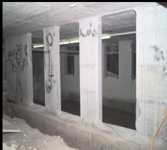
Réalisation de baies