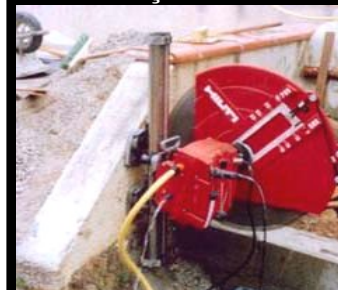
Découpe nette d'une maçonnerie