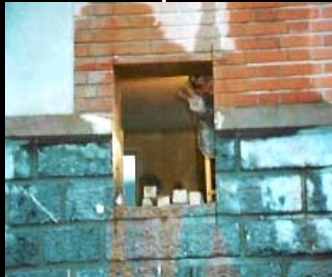
Découpe de maçonnerie et de pierre