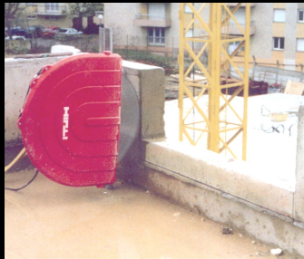
Modification sur chantier de neuf