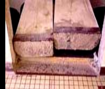
Coupe au ras du sol