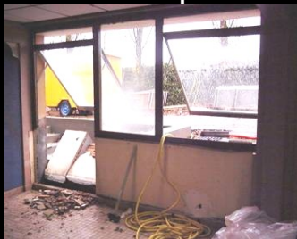
Transformation d'une fenêtre en porte