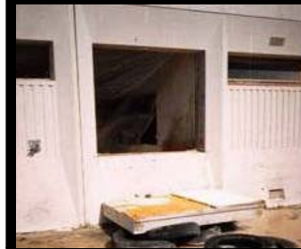
Agrandissement de fenêtre