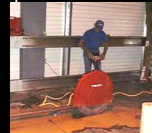
Rainurage du sol pour passer une évacuation